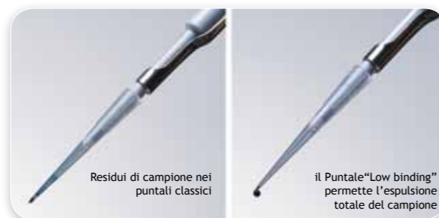
Residui di campione nei puntali classici