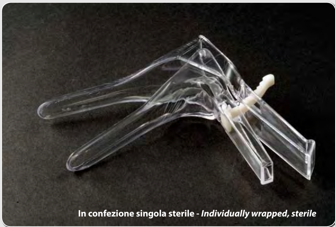
In confezione singola sterile - Individually wrapped, sterile